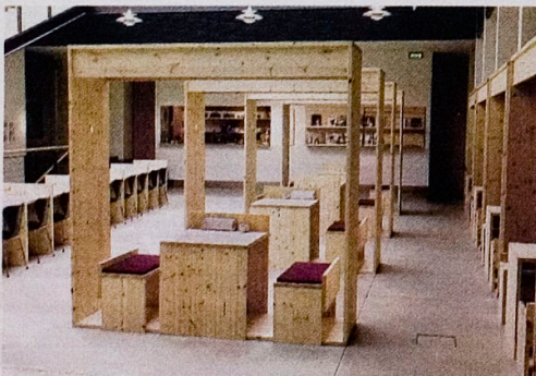
Boksene er en del af den ny møblering i Dansk Design Centers café, hvor omsætningen er steget markant, efter at fyrretræsmøblerne er rykket ind.

DERES ENGELSK FIRMAMANAVN Remove betyder, at man fjerner noget. Men d'herrer og den dame går den modsatte vej, når det gælder designmøbler i fyrretræ. De vil have træsorten genindført i stuerne, hvor man fik mere end nok af den i 70erne.