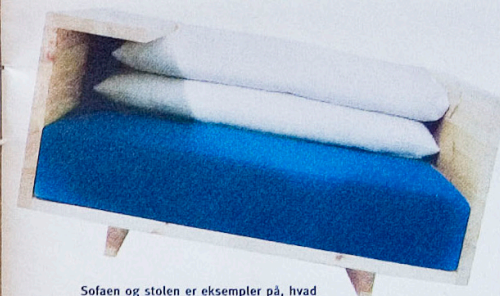
Sofaen og stolen er eksempler på, hvad Remove ønsker ind i de danske stuer.

»Træsorten signalerer også en slags menneskelighed. Man er ikke så bange for, at der kommer et mærke på et fyrretræsbord som på et af mahogni. Vi plejer at sige, at sidder man omkring et mahognibord